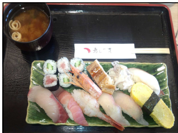
寿司一貫「店長おすすめ盛合せ」

そうそうあと一店、高知からは遠いが正和神戸工場からだと車で3分、イオンモール神戸北内に有る「海転寿司 魚河岸」は魚が旨い回転寿司店だ。