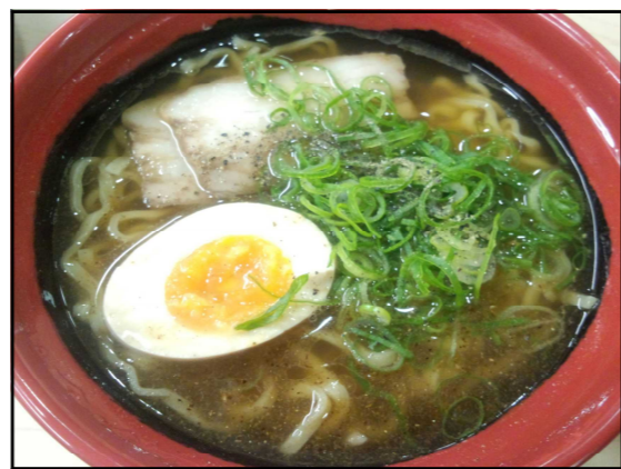
くら寿司「7種の魚介醤油ラーメン」